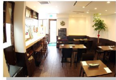
イタリア料理 トンボラ様 店舗新装工事 (江戸川区中葛西)