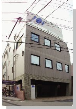
(株)日本ハイオトメーション様 本社ビル新築工事 鉄骨造 5階建 (江戸川区)