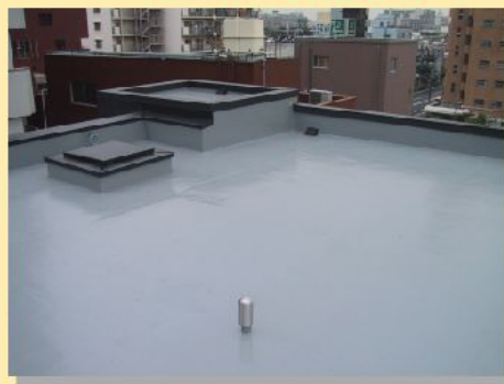
5階建ビル 防水工事施工例