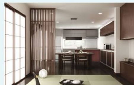
◆リビングと畳コーナーの仕切りとして