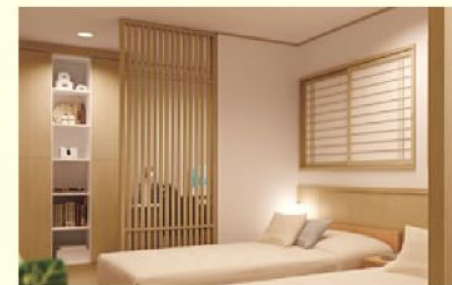
◆ベッドと書斎コーナーの仕切りとして