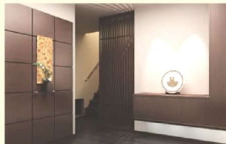
◆玄関と廊下の仕切りとして

空間をやさしく仕切りつつ光を通して気配を感じる空間に。 シンプルでモダンな縦格子デザインはさまざまなインテリアに馴染みます。