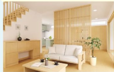
◆リビングとダイニングキッチン