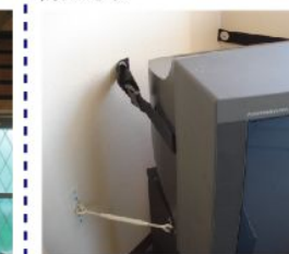
▲テレビ・テレビ台固定