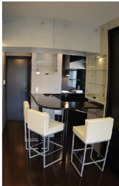
お施主様の一番のご希望のバーカウンター。お施主様がバーテンダーとなり、ご友人をおもてなしするスペースに。