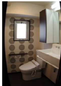
サニタリールームは、一面だけ貼り分けをして、アクセントをつけました。