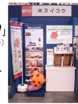
▲前回の出展ブース

構造材や内装材、設備等の各メーカーがブースを構え、最新の商品を展示します。実際に商品をご覧いただけるイベントとなっています。