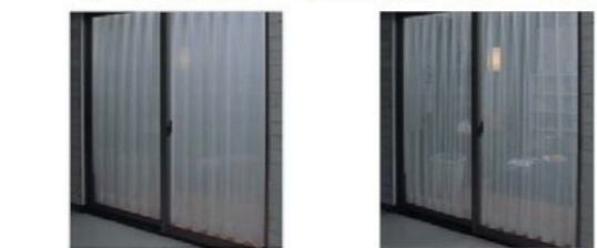
ウェーブロンシアーの場合 一般レースの場合

特殊ポリエステル糸「ウェーブロン」の使用により原糸形状の乱反射が起き、戸外からの視線を遮ります。