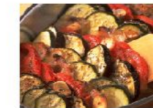
豚肉と夏野菜の重ね焼き