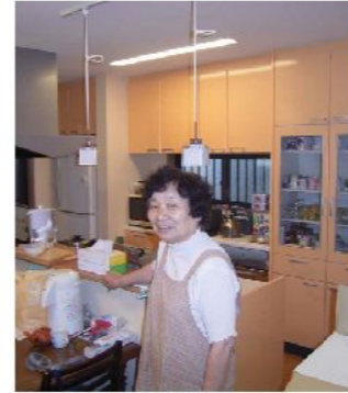
◀ キッチン 対面キッチンと 大容量の背面収納 冷蔵庫の上も しっかり収納

築35年の木造二階建 耐震性を高めたいという思いから 当社の門を叩いてくださったI様 補強工事と一緒に 水廻り/リビングのリフォームをされました