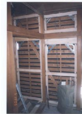
壁補強 金物を入れて 耐震ボードをはります