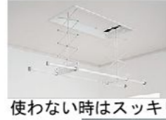
使わない時はスッキリ収納