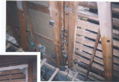
ホールダウン金物（壁内部取付タイプ） 地震の際柱が ぬけないようにします

全壊しない家を作り、命を守る 詳しくはホームページを見てね http://www.e-suikou.com